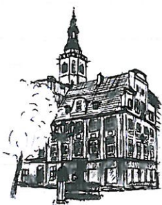
Rynek Wieża ratuszowa